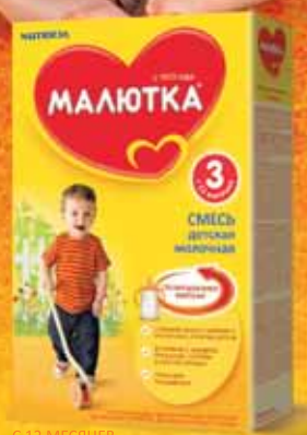
С 12 МЕСЯЦЕВ