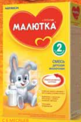
С 6 МЕСЯЦЕВ